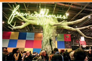
« Un arbre de la langue, à Paris, 2007., danses latines, danse et modern jazz.

pour ces atouts et mieux assurer la place du français, l'OIF a initié un projet de renforcement des compétences en français des citoyens chargés du suivi des dossiers communautaires ; ce projet bénéficiera chaque année. En Afrique, où le français est plus présent que dans aucune autre langue internationale, l'OIF, associée aux agences francophones, forme des diplomates et fonctionnaires au sein des administrations dans cinq organisations africaines, continentales travaillant à nos employés internationaux.